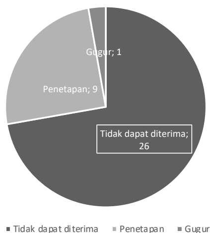
Ilustrasi 1. Pengujian Perppu Berdasarkan Kategori Amar Putusan