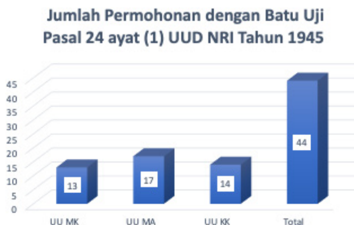
Bagan 2 Rekapitulasi Jumlah Permohonan UU Lembaga Kekuasaan Kehakiman dengan Batu Uji Pasal 24 ayat (1) UUD NRI Tahun 1945 (Rentang Waktu 2003-5 Oktober 2023)

Setiap perubahan norma dalam UU MA hampir selalu berimplikasi pada independensi hakim, struktur organisasi peradilan, dan pengawasan dan akuntabilitas kekuasaan kehakiman. Sementara itu, frekuensi pengujian UU MK yang tinggi menandakan bahwa lembaga penjaga konstitusi justru menjadi objek koreksi konstitusional yang signifikan. Hal ini mencerminkan dinamika self-constitutional review yang unik dalam sistem ketatanegaraan Indonesia, sekaligus memperlihatkan bahwa legitimasi kelembagaan MK terus diuji melalui mekanisme judicial review itu sendiri. Meskipun UU MK merupakan UU Lembaga kekuasaan kehakiman yang terbanyak diujikan namun paling sedikit yang menggunakan ketentuan Pasal 24 ayat (1) sebagai batu uji sebagaimana diungkapkan dalam Bagan di bawah ini: